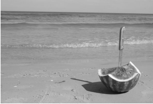
1. attēls. Arbūzs jūrmalā (Lazda, 2011, 11.lpp.)